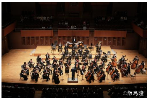
管弦楽 大阪交響楽団