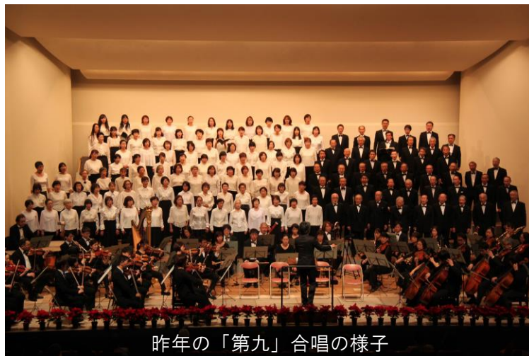
昨年の「第九」合唱の様子

また、合唱経験のない方も、ドイツ語はちょっと…という方にも、ドイツ語、発声等の基本から、わかりやすく丁寧に指導していただきます。一生懸命練習に参加し、本番で歌い終えた後の感動を共に味わってみませんか？ 詳細は裏面の参加者募集要項をご覧ください(高校生以下の方のお申込みには保護者の同意が必要となります)。