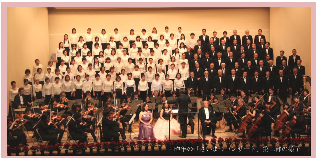
昨年の「さいまつコンサート」第二部の様子

また、合唱経験のない方も、ドイツ語はちょっと…という方にも、ドイツ語、発声等の基本から、わかりやすく丁寧に指導していただきます。一生懸命練習に参加し、本番で歌い終えた後の感動を共に味わってみませんか？ 詳細は裏面の参加者募集要項をご覧ください(高校生以下の方のお申込みには保護者の同意が必要となります)。